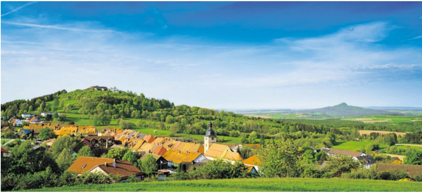
Die „Hollerhöfe“ sind hervorragend im Ortsbild von Waldeck integriert. Im Hintergrund links der Schlossberg, rechts der Rauhe Kulm.