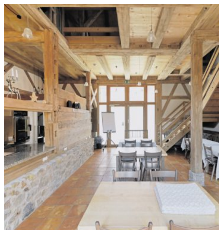
Hinweistafel am Ortseingang (links). Beispiel für ein außergewöhnliches Badezimmer (Mitte). Einer der sanierten Stadel, die alles bieten, was ein moderner Konferenzraum braucht.